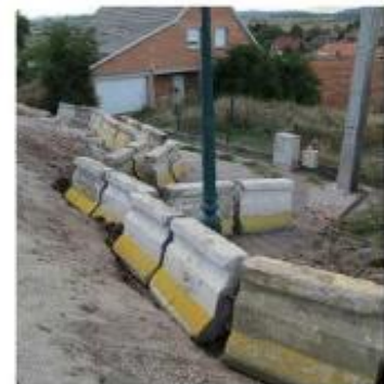
Photo n°3 : Dispositif de lutte contre le ruissellement

D'autres aménagements sont prévus, comme la création d'un avaloir à l'amont immédiat de la plateforme, permettant ainsi d'évacuer dans le réseau pluvial les eaux de l'impasse du Koellberg avant qu'elles ne traversent le chantier. Ces aménagements seront construits dès le départ des équipements en place, soit fin octobre.