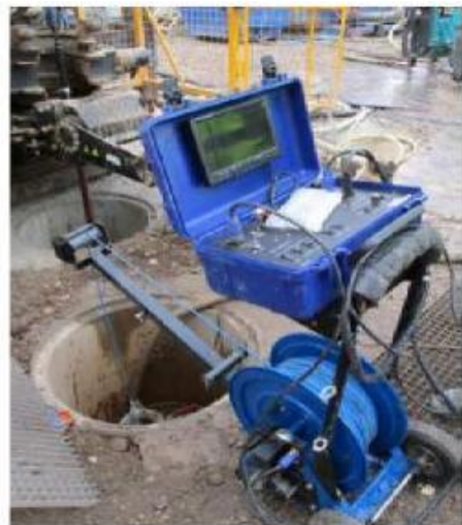
Photo n°2 : Réalisation d'essais dans l'ouvrage PMS