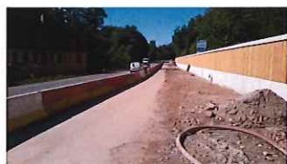
Mur de soutènement déplacé au Kronthal.

Un mur de soutènement a ainsi été déplacé, ainsi qu'une sécurisation d'une conduite de gaz.