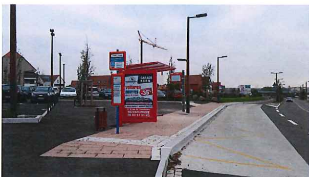
Parking P+R aménagé à Marlenheim 250 places de stationnement au total ont déjà été réalisées sur trois P+R.

L'objectif de garantir les temps de parcours des bus impose de réaliser en priorité des travaux de voies réservées dans le sens de la congestion la plus importante. C'est ainsi que les aménagements de l'été 2014 à Ittenheim et Handschuheim, mis en service début novembre, constituent la première étape qui s'étendra jusqu'à Furdenheim. Ils permettront dans un premier temps de réguler le trafic important du soir, sur la RN4 au retour de Strasbourg et fluidifier le passage des bus dans la traversée d'Ittenheim. Ces travaux se prolongeront jusqu'à Furdenheim, pour permettre une régulation complète et coordonnée sur toute cette section de la RD1004.