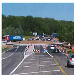
Giratoire du Zehnacker à Wasselonne, en attente de la voie axiale du TSP0.

Du fait de l'arrivée de cette voie axiale, des travaux préparatoires ont déjà été réalisés dans le Kronthal.