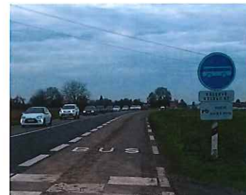
Voie BUS provisoire à l'Est d'Ittenheim En attente de la mise à 2x2 voies de la RN4 par l'Etat.

(1) : 14 blessés et 1 mort de 2009 à 2011 à Ittenheim