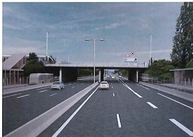
Photomontage du TSP0 sur l'A351 et de la future station d'arrêt au pont Eluard - connexion avec le tramway A2 à HautePierre.

Selon les dernières informations, ce dossier devrait être soumis une enquête préalable à la déclaration d'utilité publique au 1er semestre 2015. L'aménagement de l'A351 devrait être la première étape de ces travaux à l'horizon 2018.