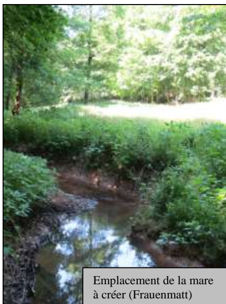
Emplacement de la mare à créer (Frauenmatt)