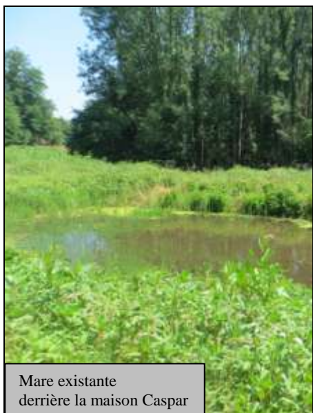
Mare existante derrière la maison Caspar

La Commune d'Allenwiller s'est portée candidate au projet « 100 mares en forêt publique alsacienne » dont l'objectif est de valoriser la biodiversité associée aux petites zones humides. Deux mares ont été retenues pour Allenwiller, l'une existante près de la maison Caspar sera réaménagée, une autre sera créée sur la Sommerau au lieudit Frauenmatt. Ces projets sont subventionnés par l'Agence de l'Eau Rhin – Meuse à hauteur de 60 %. L'ONF assure la maîtrise d'œuvre et l'assistance à maître d'ouvrage.