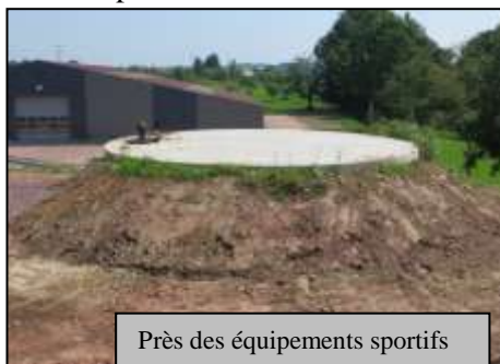
Près des équipements sportifs