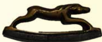
Fusil (briquet) à poignée en forme de chien en bronze, 18 e siècle.