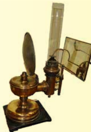
Lampe à réflecteur, fin du 19 e - début du 20 e siècle.