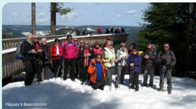
Pâques à Baiersbronn

Nous remercions dès à présent toutes les personnes qui nous soutiennent en étant membre de notre association, ainsi que la Collectivité de Marmoutier. Ce soutien nous encourage à continuer notre démarche de protection de la nature et de l'entretien des sentiers de randonnées et ses infrastructures.