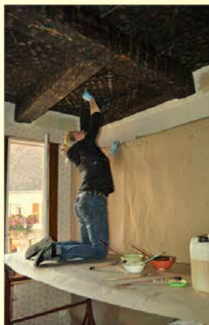
Retouche de la polychromie ancienne.