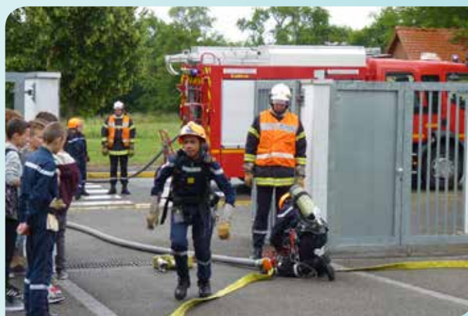
Démonstrations des sapeurs-pompiers volontaires de l'UT Marmoutier