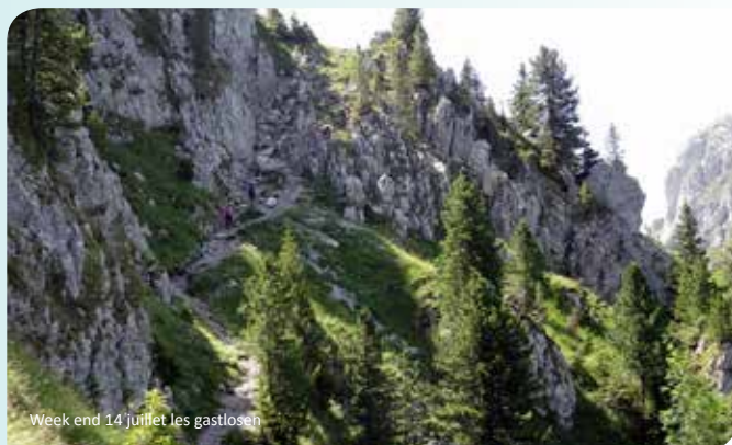
Week end 14 juillet les gastlosen

Le programme 2016 est en cours d'élaboration et on peut déjà noter quelques sorties principales : WE Neige à ST Märgen, le séjour de Pâques à Rudesheim en Allemagne, un WE en Autriche, une traversée des Alpes de Jenbach (Autriche) à Vipiteno (Italie Tirol du Sud), ainsi que toutes les sorties tout au long de l'année. Pour 2016, notre section a décidé de re-