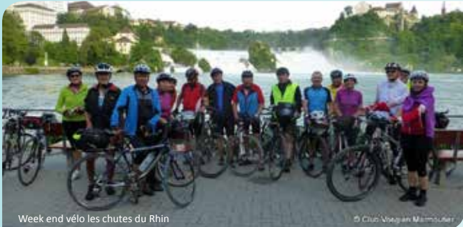
Week end vélo les chutes du Rhin

La traditionnelle sortie de Pâques nous a menés dans la région de Baiersbronn. Le temps était idéal et la neige était encore bien présente. Et c'est le long du Rhin de Bad Säckingen à Schaffhausen, qu'un groupe de cyclistes a passé le week-end de l'Ascension. 420 kms ont ainsi été avalés sous une météo un peu mitigée. Notre dernier séjour s'est déroulé en Suisse,