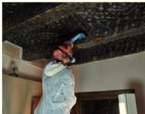
Traitement et consolidation du bois par injection.