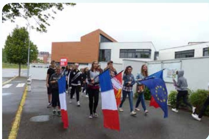
Implication des Collégiens et professeurs dans la Commémoration des 42.