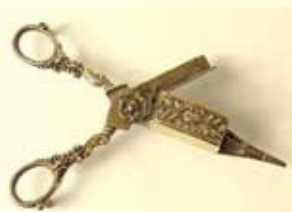
Mouchette en bronze, 19 e siècle.