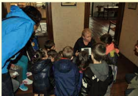
Cette restauration a été l'occasion pour les élèves de Marmoutier de découvrir le métier de restaurateur.