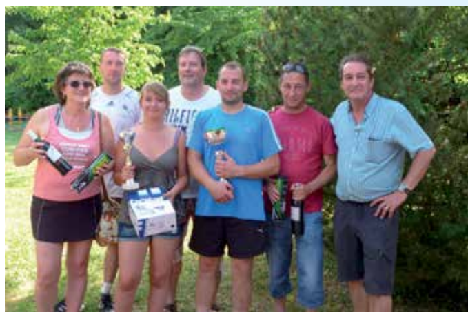
Les vainqueurs du Tournoi Interne 2015 de tennis.

La traditionnelle Fête du Tennis et les finales du Tournoi Interne ont permis de réunir de nombreux participants autour d'un barbecue, pour clôturer l'année sportive 2015.