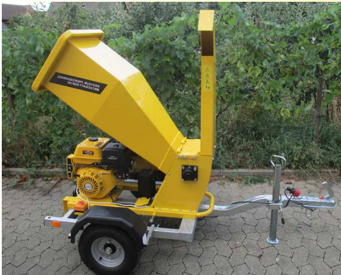
Photo du broyeur : le broyeur sur châssis de l'association Le Bonheur est dans le pré est à la disposition de ses adhérent-e-s pour contribuer à réduire les volumes de déchets apportés en déchèterie.