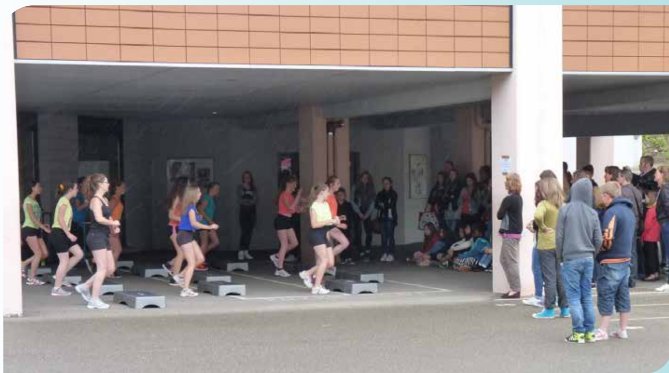
Les diverses activités proposées par le collège