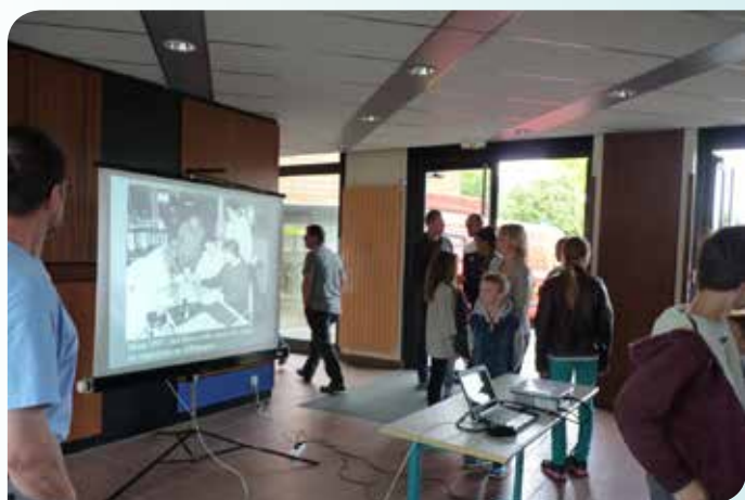
Projection de photos sur l'histoire du collège