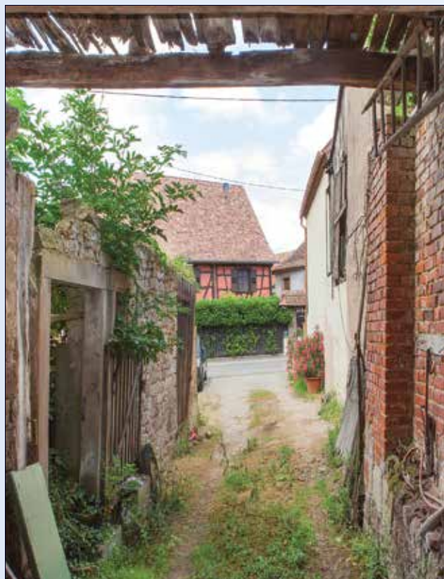
L'impasse en 2015 (vue depuis l'entrée de la grange)