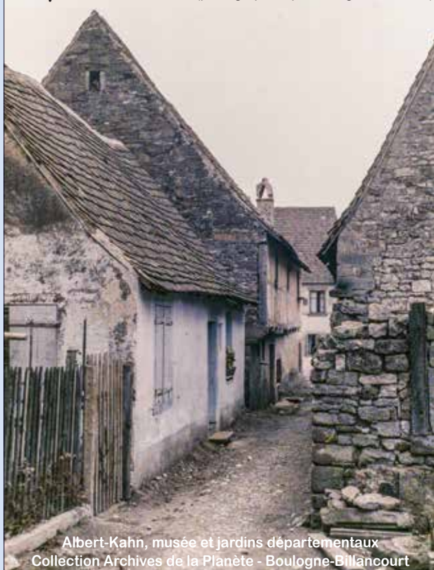
L'impasse en 1919 (photographiée par Georges Chevalier)

Albert-Kahn, musée et jardins départementaux Collection Archives de la Planète - Boulogne-Billancourt