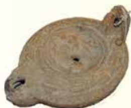
Lampe romaine en terre cuite, 230 après J.-C.

Cette exposition sera l'occasion pour les visiteurs de découvrir des trésors d'inventivité : des lampes à huile, à gaz, des boules de dentellière, des chandelles ou encore des lampes à réflecteur.