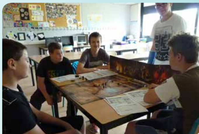
Les diverses activités proposées par le collège