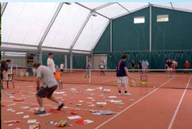
Quelques-uns des lots à gagner au «Touché-Gagné».

Après des vacances bien méritées, il était temps de penser à reprendre les activités :