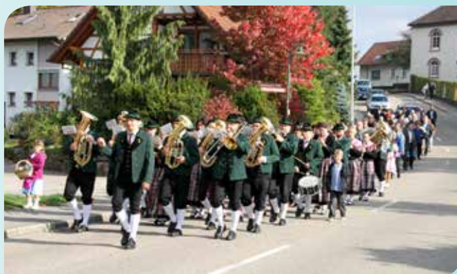
Défilé de la Trachtenkapelle