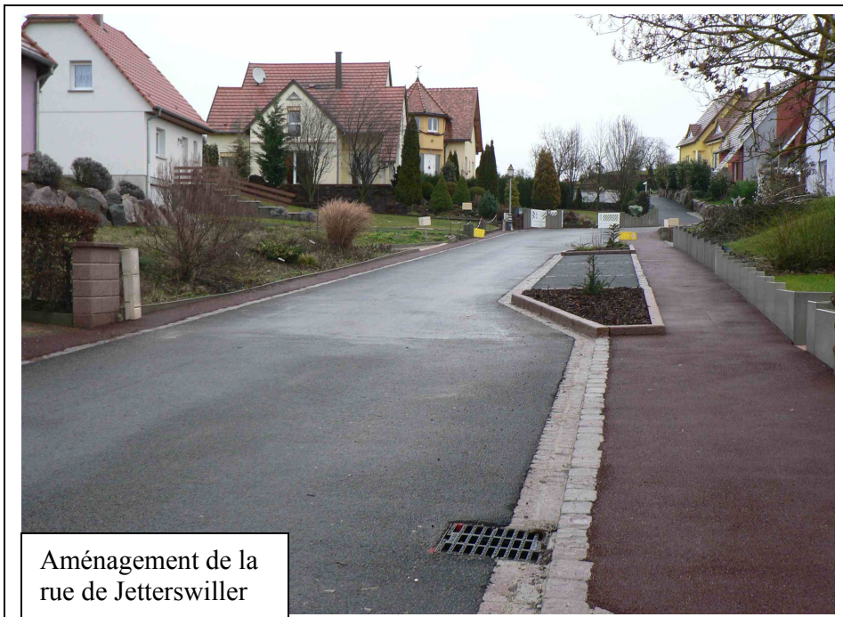
Aménagement de la rue de Jeterswiller