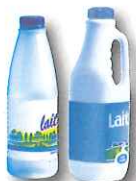
bouteilles de lait