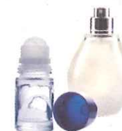
flacons de parfum