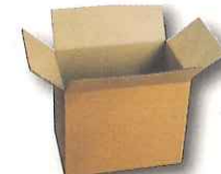
petits cartons plats pliés