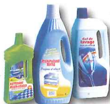
flacons de produits ménagers