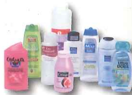
flacons de produits d'hygiène