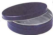
boîtes en aluminium, boîtes en acier, bougies