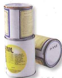
Solides / pâteux