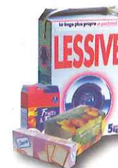
boîtes et suremballages en carton