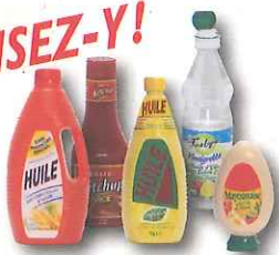
bouteilles d'huile, mayonnaise, vinaigrette, ketchup, ...