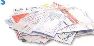
courriers, lettres, impressions