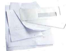
papiers bureau, enveloppes