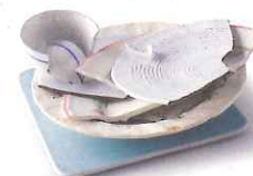
Vaisselle, faïence, porcelaine, verre brisé, miroir