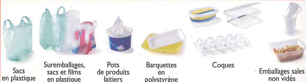
Sacs en plastique

Ne mettez pas > A jeter dans votre poubelle habituelle