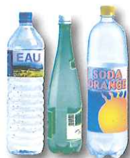
bouteilles en plastique: eau, jus de fruit, soda...