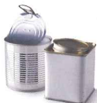
boîtes de conserve et boîtes à thé