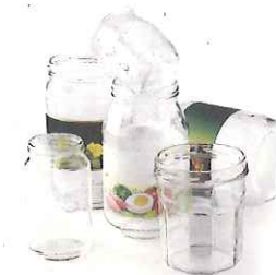
bocaux et pots