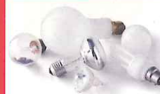
Ampoules (classiques non recyclées) et à filament

Ne mettez pas > A jeter dans votre poubelle habituelle