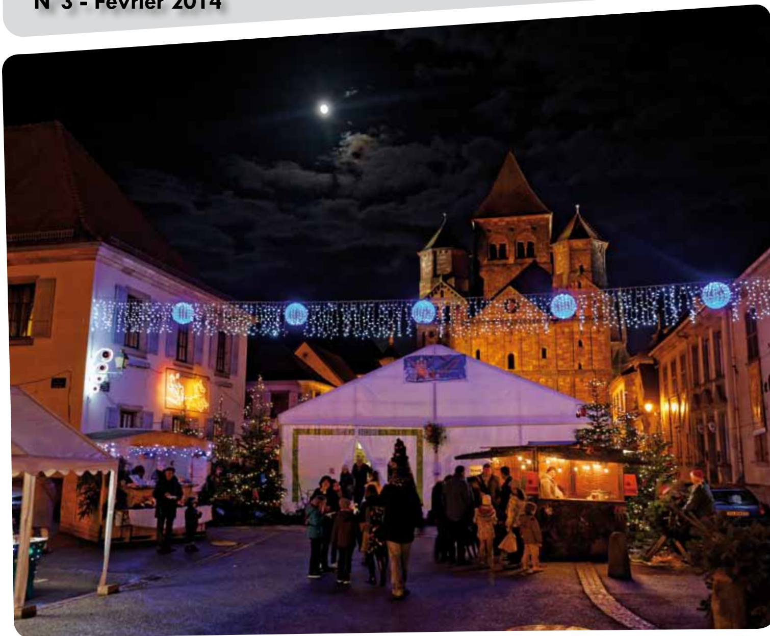
Les festivités de fin d'année à Marmoutier