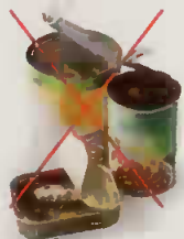
Emballages mal vidés

Je ne mets pas > A jeter dans votre poubelle habituelle