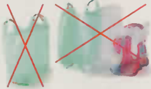
Sacs en plastique Suremballages, sacs et films en plastique