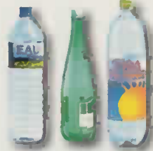
bouteilles en plastique: eau, jus de fruit, soda...