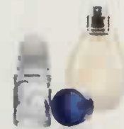
flacons de parfum

Je ne mets pas > A jeter dans votre poubelle habituelle