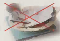
Vaisselle, faïence, porcelaine, verre brisé, miroir