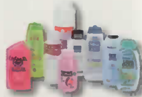
flacons de produits d'hygiène