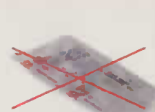
Films en plastique de suremballage de journal