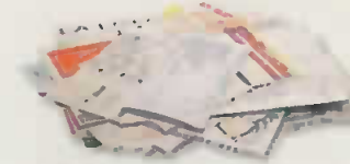
courriers, lettres, impressions