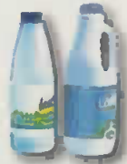
bouteilles de lait

je mets les BOUTEILLES et FLACONS en PLASTIQUE en vrac et vides .