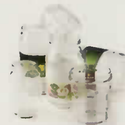
bocaux et pots