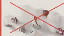
Ampoules (classiques non recyclées) et à filament

Je ne mets pas > A jeter dans votre poubelle habituelle