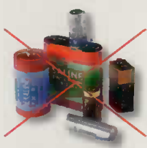
Piles et batteries