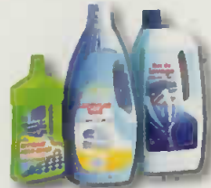
flacons de produits ménagers