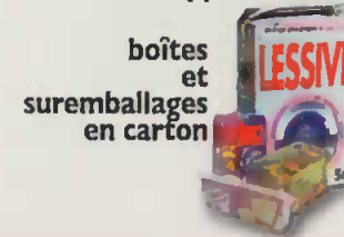
boîtes et suremballages en carton