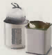
boîtes de conserve et boîtes à thé