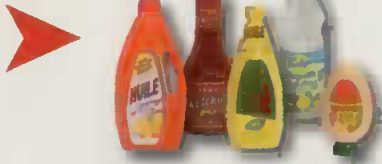
bouteilles d'huile, mayonnaise, vinaigrette, ketchup, ...