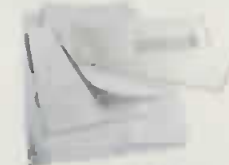
papiers bureau, enveloppes